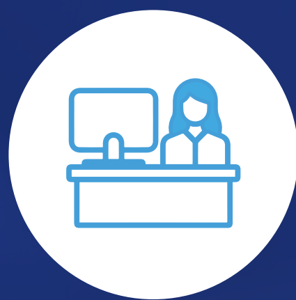
Agente de viajes y turismo