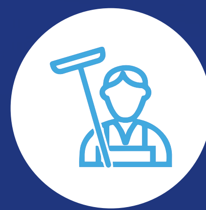
Operador de check-in de agencia de viajes.