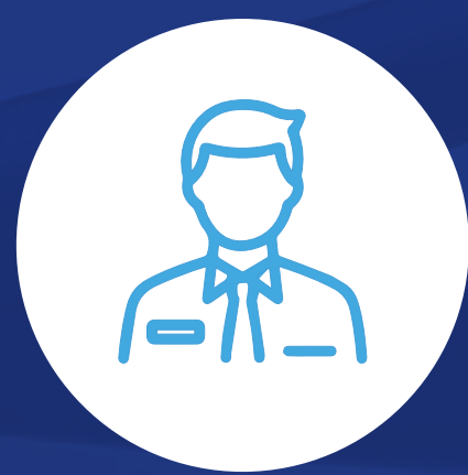
Auxiliar de agencia de viajes