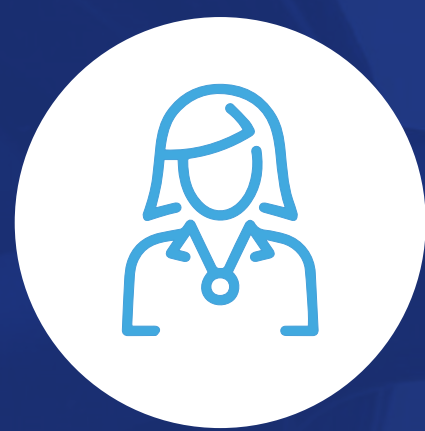
Agente de emisión de tiquetes