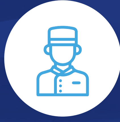
Auxiliar de ventas y reservaciones de turismo