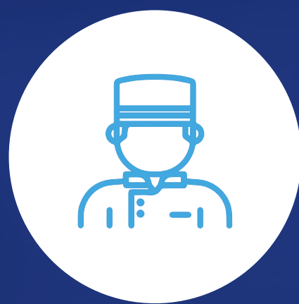
Asesor comercial de viajes