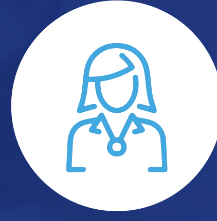
Empleado servicio al viajero